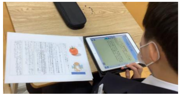
写真4 ロイロノートの活用