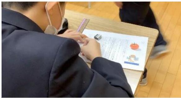
写真3 ワークシートに記入

文章の理解が難しい生徒には、穴埋め式にしたり、簡単な言葉を選択肢にしたり、文章読解力が高い生徒には、文章を要約して情報を整理するなど、生徒本人の理解度や語彙力等に合わせて、ワークシートを準備した。ワークシートに記入する文言を考える際に、画像や動画などそれぞれの実態に合ったヒントを出すことで、ワークシートに合う言葉を書くことができた(写真3)。また、ロイロノートを活用することで、ワークシートで考えた文言を容易に物語の脚本原稿にすることができ、達成感を味わっている姿が見られた(写真4)。