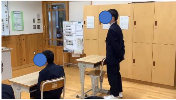
写真1 言葉遣い、姿勢の確認