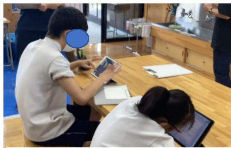
写真7 自己評価場面の設定

体験に向けた練習場面では、どのようなポイントで話すことが大切か、「声の大きさ」「スピード」「表情」などのチェック表を提示したことで、意識しながら話すことができた。また、練習場面を動画に撮って振り返り場面に提示し、チェック表を参考にしながら自己評価をした(写真7、8)。自己理解が難しい生徒については、友達からアドバイスを受ける時間を設けたことで、自分の考えと友達との意見とをすり合わせて考えることができた(写真9)。人前で話すことに苦手意識をもっている生徒もいるが、「小学生に伝える」という目的の基、言葉一つ一つを大切に丁寧に話すことにつながった。