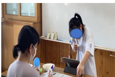
写真5 動きを付けながらの発表練習

自分たちが作業学習で行っていることの紹介であったが、いざ授業をしてみると、担当する工程について言葉で表現することが難しい場面があった。そこで、言葉のもつ意味を深く考えさせ、具体的な言葉で表現できるよう、言葉と動きとを対応させながら話す時間を設けた(写真5)。言葉で表現することが難しい生徒も、道具を持ちながら、話す内容を考えたことで、「ボンドを塗るときは、刷毛を真ん中から端に向かって塗ります」と話すなど、相手に伝わるよう具体的に考え話すことができた(写真6)。また、道具を使って説明する際に、「これ」「あれ」など指示語を活用するなど、表現方法を工夫することができた。